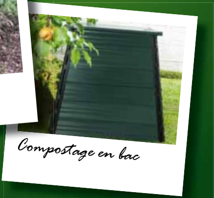
Compostage en bac