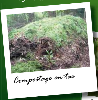
Compostage en tas

■ Le compostage en bac : cette technique consiste à déposer les déchets fermentescibles dans un composteur avec une structure en bois, en métal ou en plastique. Il est plus esthétique, la décomposition est homogène et plus rapide. En revanche, ce compostage en bac est adapté à des petites productions et nécessite une surveillance régulière.